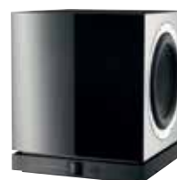
DB1 Наш самый совершенный сабвуфер – для полнокровного кинематографического звука.