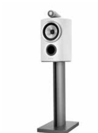
805 D3 Наша единственная полочная колонка на стойке с алмазным твитером.