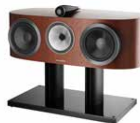
HTM1 D3 Колонка центрального канала для тех, кто согласен только на самое лучшее.