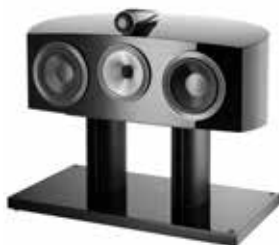
HTM2 D3 Идеальная колонка центрального канала для младших моделей в сериях.