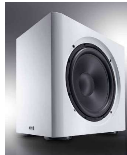
15" вуфер повышенной мощности с длинноходной подвижной системой, усиленным бумажным диффузором и мощной магнитной системой