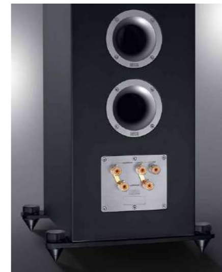
Цельное крестообразное алюминиевое основание с массивными регулируемыми металлическими шипами