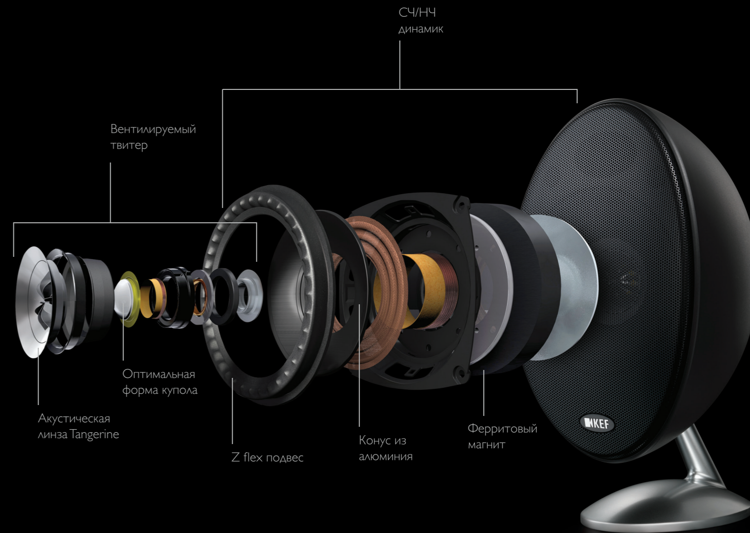
E301 Uni-Q модуль

Удостоенная многочисленных наград знаковая акустическая система домашнего кинотеатра KHT компании KEF благодаря своему насыщенному, объемному и реалистичному трехмерному звуковому образу произвела настоящую революцию в сфере домашних развлечений. Вдохновленная «Eggs» дизайном, новая акустика E Series объединила в легко узнаваемых компактных сателлитных акустических системах и полностью соответствующем им по стилю мощном сабвуфере целый набор уникальных передовых технологий. Акустика выпускается с шелковисто-матовой отделкой глубокого черного или чистого белого цвета, дополненной хромированными подставками из литого алюминия. Подставки легко поворачиваются, и превращаются в настенные кронштейны. Дополнительно можно приобрести напольные стойки.