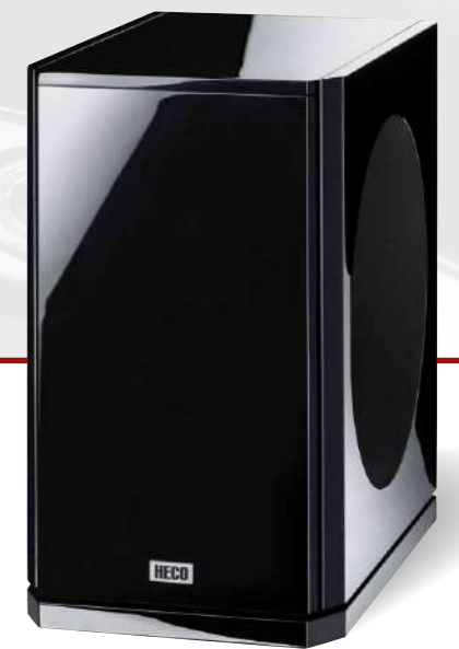
Aleva GT Sub 322 A

Конструкция Оснащение Мощность (RMS/макс.) Сопротивление Частотный диапазон Частота кроссовера Чувствительность Варианты исполнения Габариты (ШxВxГ) 2-полосная центральная колонка 2 x 130 mm WM/28 mm T 100/160 W 4 - 8 Ω 35 - 42 000 Hz 3 400 Hz 90 dB Черный рояльный лак, Белый рояльный лак 510 x 180 x 280 mm