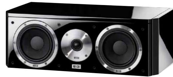
Aleva GT Center 32

Конструкция Оснащение Мощность (RMS/макс.) Сопротивление Частотный диапазон Частота кроссовера Чувствительность Варианты исполнения Габариты (ШxВxГ) 2-полосная центральная колонка 2 x 130 mm WM/28 mm T 100/160 W 4 - 8 Ω 35 - 42 000 Hz 3 400 Hz 90 dB Черный рояльный лак, Белый рояльный лак 510 x 180 x 280 mm