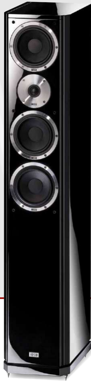
Aleva GT 602

Конструкция Оснащение Мощность (RMS/макс.) Сопротивление Частотный диапазон Частота кроссовера Чувствительность Варианты исполнения Габариты (ШxВxГ) 3-полосные с фазоинвертором 2 x 130 mm WO/130 mm WM/ 28 mm T 180/320 W 4 - 8 Ω 27 - 42 000 Hz 350/3 400 Hz 91 dB Черный рояльный лак, Белый рояльный лак 1207 x 1100 x 350 mm