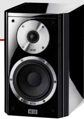
Aleva GT 202

Конструкция Оснащение Мощность (RMS/макс.) Сопротивление Частотный диапазон Частота кроссовера Чувствительность Варианты исполнения Габариты (ШxВxГ) 2-полосные с фазоинвертором 130 mm WM/28 mm T 80/140 W 4 - 8 Ω 36 - 42 000 Hz 3 400 Hz 90 dB Черный рояльный лак, Белый рояльный лак 207 x 320 x 280 mm