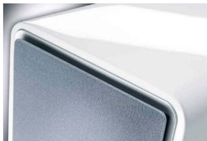
Съемный гриль имеет магнитное крепление

Фронтальная накладка на панель имеет специальную форму для обеспечения лучших дисперсионных свойств