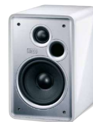
Music Colors 100

Никаких компромиссов с точки зрения эстетики или акустического оформления: HECO Music Colors в среде проживания