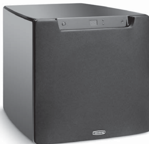
Сабвуфер с цифровым эквалайзером и высокой выходной мощностью