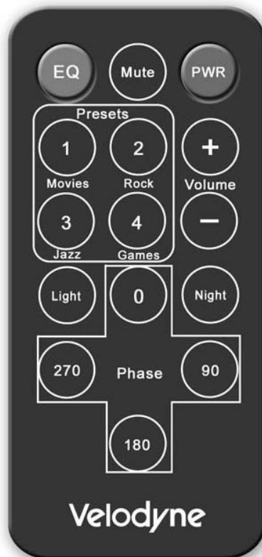
Рисунок 3. Пульт ДУ

ПРИМЕЧАНИЕ: Пульт ДУ SPL-Ultra/Optimum можно крепить магнитным способом к задней стороне сабвуфера (в верхнем левом углу).