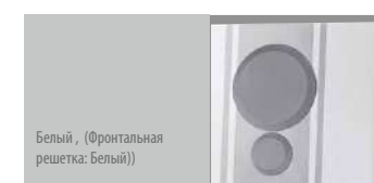
Белый, (Фронтальная решетка: Белый)