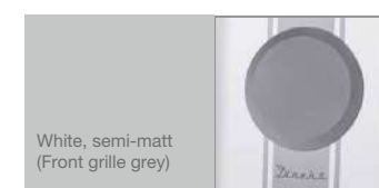
White, semi-matt (Front grille grey)