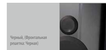
Черный, (Фронтальная решетка: Черная)