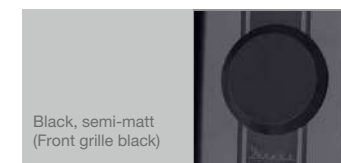
Black, semi-matt (Front grille black)