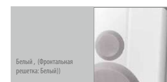
Белый, (Фронтальная решетка: Белый)