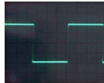
Прямоугольный сигнал 1кГц Tусана.